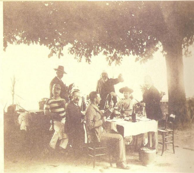
EN COUVERTURE : 1902, LE RESTAURANT BOCUSE AUJOURD'HUI ABBAYE DE COLLONGES, LES PÊCHEURS SUR LE CHEMIN DE HALAGE ET LE DÉJEUNER SOUS LES OMBRAGES. CI-DESSUS : L'ÉTÉ À COLLONGES, LE BORD DE SAÔNE ET LES BOULISTES.